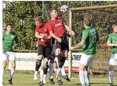
Der TSV Lehmké warf gegen Ostedt alles in die Waagschale und hatte am Ende auch das Glück des Tüchtigen.